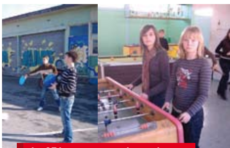
Le CEJ accompagne les actions en direction de la petite enfance, de l'enfance et de la jeunesse

Sont également pris en compte tous les séjours organisés pendant les vacances scolaires. Toutes ces activités sont proposées dans l'esprit du projet éducatif local élaboré par l'équipe municipale en 2004.