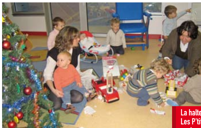
La halte-garderie, Les P'tits Pieds, sont concernés par le nouveau CEJ

Ce contrat engage la municipalité et la CAF pour quatre ans (2008-2011). Cette dernière participe à hauteur de 843.000 € pour un coût total des actions prévues estimé à 2.200.000 €.