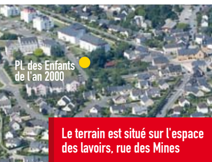
Le terrain est situé sur l'espace des lavoirs, rue des Mines

Une partie du terrain récemment acquis par la commune va être vendue pour la construction d'un cabinet dentaire. Il se situe à proximité de la place des Enfants de l'an 2000, où sera également implantée la future maison de santé. Le chantier va débuter prochainement. L'ouverture du cabinet est prévue pour la fin de l'année.