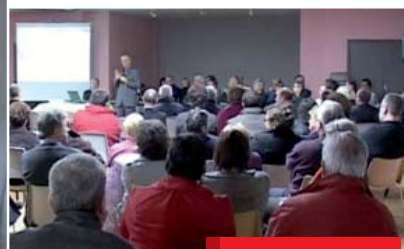
Cette soirée fut un moment d'échanges entre tous les participants