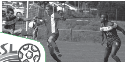
Les L'huissériens avec leur nouveau maillot lors des matchs du 20 septembre