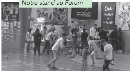
Notre stand au Forum

Nous vous attendons nombreux pour supporter nos équipes et mettre de l'ambiance cette saison ! Prochain événement, grand loto du club, samedi 7 novembre en soirée.