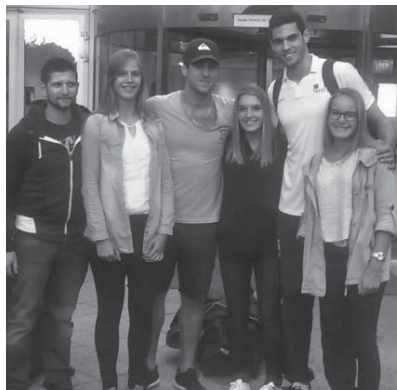
Le VBH était présent lors du match de l'équipe de France masculine contre le Brésil (champions du monde en titre), dimanche 6 septembre à Paris avec une victoire pour la France 3 sets à 2

L'équipe senior masculine recrute aussi, avec le titre de champion départemental à conserver !