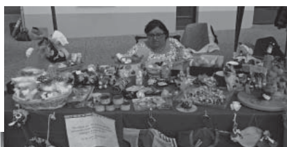
Nos réalisations sont proposées à la vente, comme ici lors du marché d'été